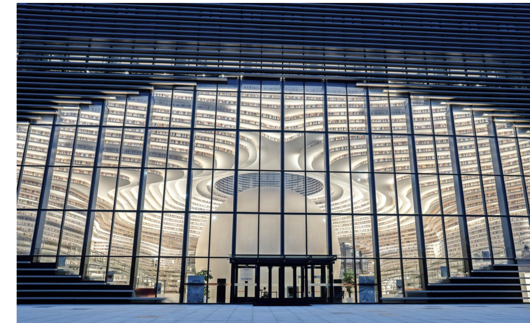
Der Zukunft zugewandt: die Binhai-Bibliothek in Tianjin

Wie sollte sich die deutsche Chinaforschung vor diesem Hintergrund normativ und wissenschaftspolitisch positionieren? Wie kann sie sicherstellen, dass ihr Blick auf China hinreichend objektiv bleibt? Und welche Art neuer Chinakompetenz brauchen wir an den Universitäten und im gesellschaftlichen Raum, um jungen Men-